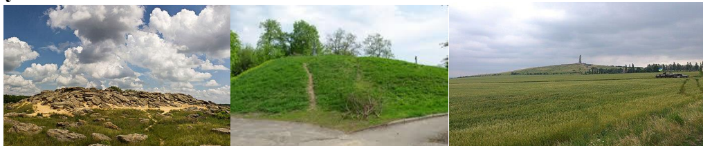
А Кам'яна могила

2) Виберіть зображення кургану, який згадано в історичній пісні «Ой Морозе, Морозенку...».