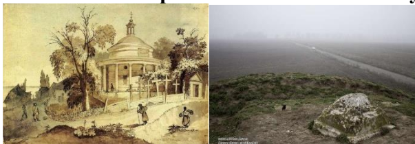
Г Аскольдова могила Д Гостра могила